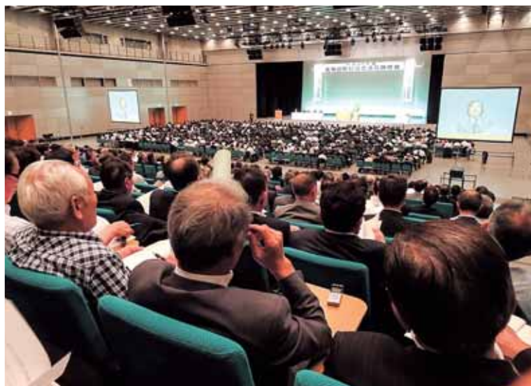
全道の町村議員が一堂に会した研修会場